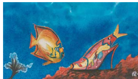
Les péchés de l'homme