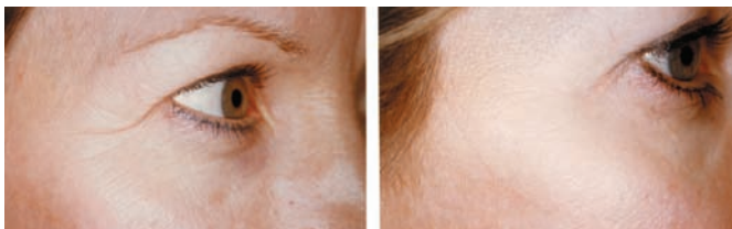
Ouverture du regard avant-après RX Botox