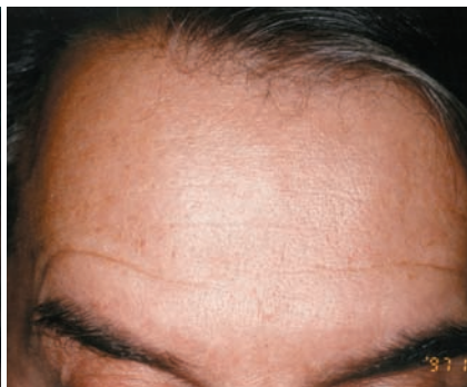
1997 : rides du front en mouvement après traitement Botox. La réduction du mouvement du muscle frontal hyperactif diminue les rides du front. En agissant sur la cause, Botox prévient l'accentuation future de ces rides.