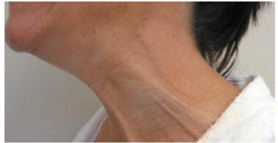
Diminution de la bandelette verticale après traitement avec Botox