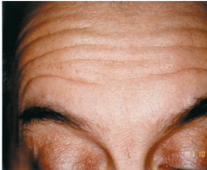
1997 : rides du front en mouvement avant RX Botox. Ces rides sont causées et accentuées par le mouvement constant du muscle frontal.