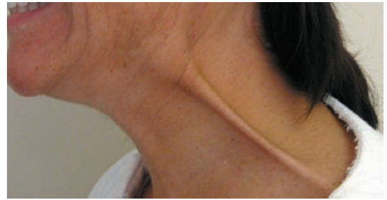
Bandelette verticale du cou avant traitement avec Botox