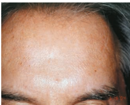
Suivi 2003 : rides du front au repos de moins en moins creuses suite à un entretien avec des RX Botox.