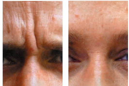
Rides de la glabella avant-après RX Botox