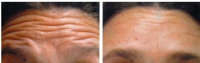
Rides du front avant-après RX Botox

« Finalement, une bonne formation de la part du médecin et une bonne communication patient-médecin favoriseront l'obtention des résultats attendus qui seront plus réalistes, naturels et équilibrés. »