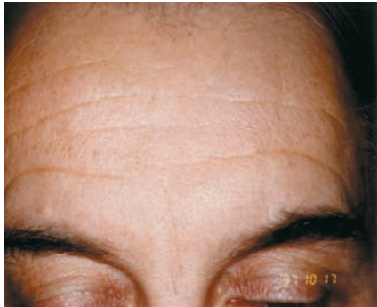
1997 : rides du front au repos avant RX Botox.

On nous pose souvent les questions : qu'advient-il si je cesse les injections de Botox après plusieurs années de traitements? Est-ce que le visage va me tomber plus vite que si je n'avais rien fait ? Vais-je avoir besoin d'un lift chirurgical? Vais-je vieillir plus vite que normalement? Ici, la réponse à toutes ces questions est tout simplement NON. Suivez l'évolution des rides du front du patient illustrées dans l'encadré pour bien le comprendre.