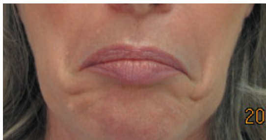
Muscle déprimeur de l'angle de la bouche ( ride de la marionnette) avant traitement avec Botox