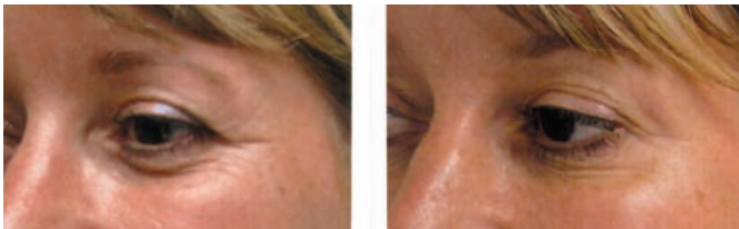
Dépresseur latéral du sourcil : en traitant ce muscle avec Botox, la portion externe de la paupière supérieure est remontée.