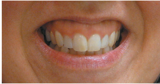
Exposition excessive de la gencive lors du sourire avant traitement avec Botox

« Même si on obtient des résultats très intéressants avec les traitements Botox, il n'en reste pas moins que souvent on aura avantage à combiner avec d'autres soins. En effet, le développement le plus intéressant dans le domaine du rajeunissement facial ne repose pas sur la découverte d'un produit ou d'une technologie en particulier mais plutôt sur la possibilité de combiner plusieurs de ces traitements pour en arriver à des résultats autrefois impossibles à réaliser. »