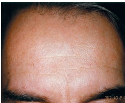
1997 : rides du front au repos diminuées après RX Botox.