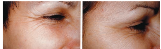
Rides de la patte d'oie avant-après RX Botox