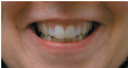
Diminution de l'exposition de la gencive après traitement avec Botox